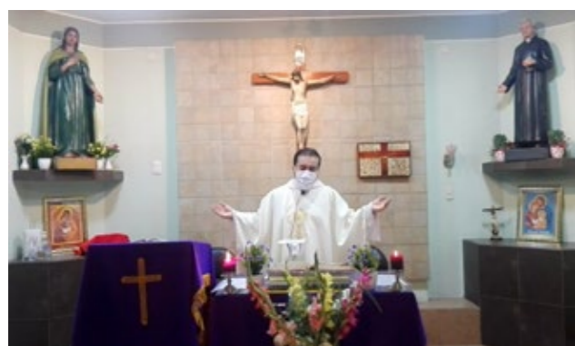
Parroquia El Señor de la Esperanza

Creo que hay mucho que se puede aprender en cómo usar bien la tecnología disponible como medio de evangelización. El uso de las redes sociales por parte de la Iglesia es una oportunidad para llegar a personas que se habían alejado de los templos. Hay diferentes experiencias que sería un aprendizaje para los párrocos compartir e intercambiar ideas unos con