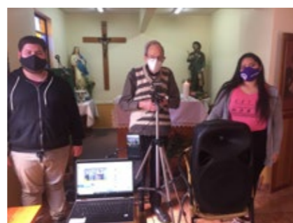
Parroquia San Roque

otros. Hay también aprendizaje en cursos de formación, formación sacramental, reuniones virtuales, plataformas como Facebook, Streamyard, Youtube, etc. Las Parroquias están llevando una excelente acción solidaria, desde bingos virtuales, comedores, talleres en familia, terapia, etc., también se podría compartir sobre los aprendizajes en la solidaridad, esencial al evangelio.